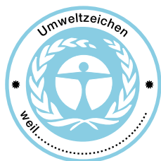
Àngel Blau (Blaue Engel) Alemanya

Etiquetes similars al Distintiu de garantia de qualitat ambiental presents en el mercat europeu, atorgades per l'Administració.