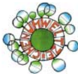
Umweltzeichen baume Àustria