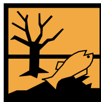
Perillós per al medi ambient